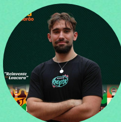
Celo, Coord de Comunica